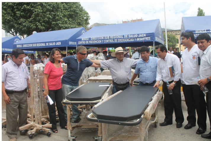
Camillas nuevas para los hospitales, junto con otro mobiliario, son parte del convenio firmado entre el Fondo Binacional y el Gobierno Regional.

En el marco del convenio entre el Plan Binacional y el Gobierno Regional de Cajamarca, el 14 de noviembre se hizo la entrega simbólica de los equipos médicos destinados a 52 Centros de Salud de las redes de Jaén y San Ignacio.