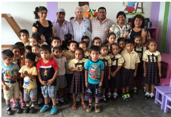
Inauguración del nido El Palto, contó con la presencia de las autoridades educativas locales y los alumnos

El 12 de noviembre se inauguraron también las obras de remodelación de la IE N°278 – El Palto, en el distrito de Yamón, Utcubamba - Amazonas, que cuenta con una población estudiantil aproximada de 50 alumnos por año.