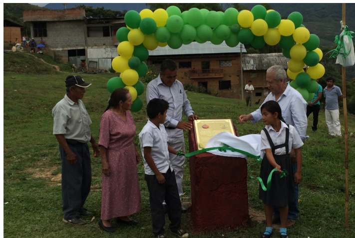
La inauguración de la obra contó con la participación de los niños del caserío y de las autoridades locales

Cerca de 350 habitantes y 3 instituciones educativas públicas se han visto beneficiadas.