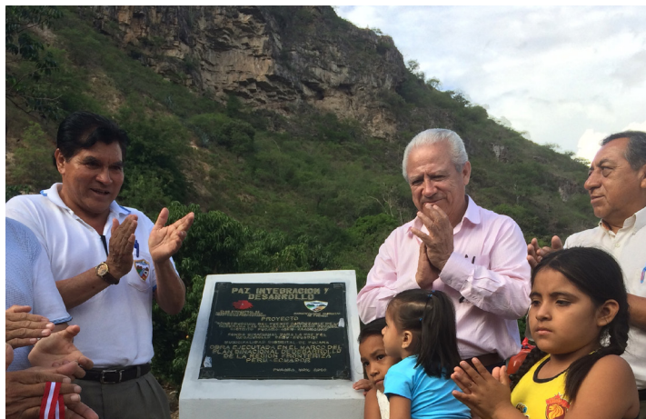
Autoridades locales y pobladores participaron de la inauguración.

El puente, de 10 metros de largo y vías en ambos sentidos, fue construido con un presupuesto de S/.337,350.86, aportados en un 78% por el Fondo Binacional y un 22% por la Municipalidad Distrital, respectivamente.