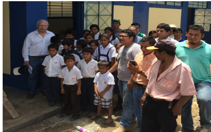
La inauguración contó con alumnos, autoridades educativas y pobladores

El presupuesto total fue de S/.344,790.90, aportados por el Fondo Binacional y la Municipalidad Distrital en un 77% y 23%, respectivamente, de conformidad al convenio firmado en febrero de 2014. La obra beneficiará a un aproximado de 45 alumnos al año.