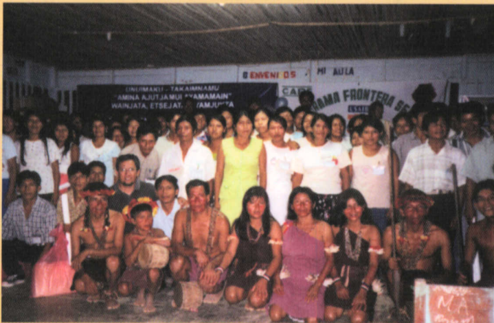
Líderes indígenas participantes de los talleres "Derechos Humanos y Ciudadanía".

La provincia de Condorcanqui, en el departamento de Amazonas, habitada desde tiempos ancestrales por el pueblo Aguaruna, ha sido el escenario de diversas actividades planificadas por el Programa Frontera Selva.