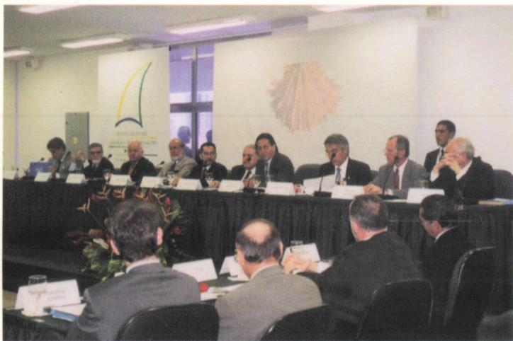
Presidentes y Cancilleres del Perú y Ecuador, y representantes de países amigos y organismos internacionales, miembros del CAI. Fortaleza, Brasil, 10 de marzo.

Luego de que el Presidente de la República del Ecuador, Gustavo Noboa, realizara una Visita de Estado al Perú los días 7, 8 y 9 de marzo, el presidente Alejandro Toledo partió con su homólogo ecuatoriano a la ciudad brasileña de Fortaleza, escenario de la II Reunión del Comité Asesor Internacional (CAI) del Plan Binacional de Desarrollo de la Región Fronteriza Perú - Ecuador, evento que contó con la presencia de los Cancilleres del Perú y del Ecuador, así como de los representantes de los países amigos y de organismos internacionales miembros del CAI.