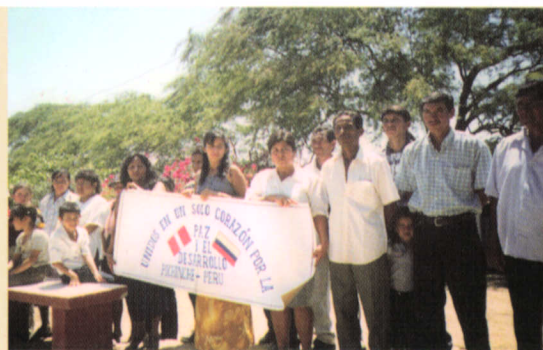
Grupo de pobladores beneficiados con el proyecto binacional de Desarrollo de Servicios de Saneamiento Básico Rural - COSUDE.

El proyecto ha tenido como fin específico otorgar a los pobladores una