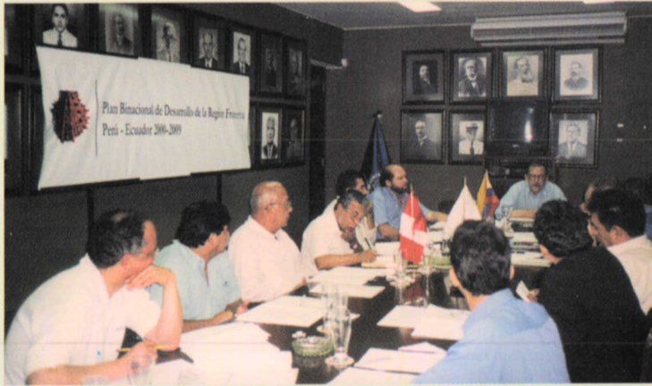
Miembros del GBPIP y Directores Ejecutivos de los Capítulos Perú y Ecuador, en la reunión de trabajo.

La ciudad de Piura fue sede de la II Reunión del Grupo Binacional de Promoción de la Inversión Privada (GBPIP) del Plan Binacional de Desarrollo de la Región Fronteriza Perú- Ecuador, llevada a cabo el pasado 4 y 5 de abril en las instalaciones de la Cámara de Comercio y Producción de Piura.