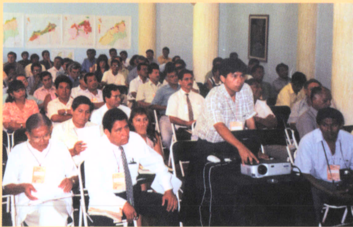
Grupo de participantes del Foro "Tumbes, debate y propuesta para el desarrollo".

La búsqueda de alternativas de progreso en los diferentes ámbitos de actuación del departamento de Tumbes fue uno de los objetivos centrales del Foro "Tumbes: Debate y Propuesta para el Desarrollo",