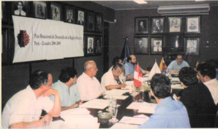
Miembros del GBPIP y Directores Ejecutivos de los Capítulos Perú y Ecuador, en la reunión de trabajo.

La ciudad de Piura fue sede de la II Reunión del Grupo Binacional de Promoción de la Inversión Privada (GBPIP) del Plan Binacional de Desarrollo de la Región Fronteriza Perú- Ecuador, llevada a cabo el pasado 4 y 5 de abril en las instalaciones de la Cámara de Comercio y Producción de Piura.