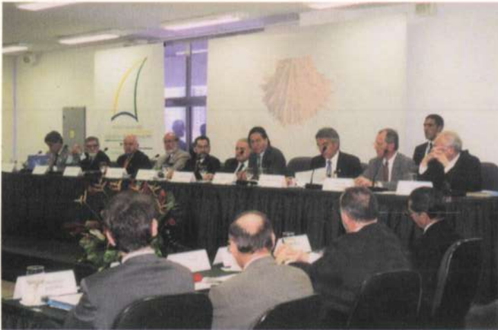
Presidentes y Cancilleres del Perú y Ecuador, y representantes de países amigos y organismos internacionales, miembros del CAI, Fortaleza, Brasil, 10 de marzo.

Luego de que el Presidente de la República del Ecuador, Gustavo Noboa, realizara una Visita de Estado al Perú los días 7, 8 y 9 de marzo, el presidente Alejandro Toledo partió con su homólogo ecuatoriano a la ciudad brasileña de Fortaleza, escenario de la II Reunión del Comité Asesor Internacional (CAI) del Plan Binacional de Desarrollo de la Región Fronteriza Perú - Ecuador, evento que contó con la presencia de los Cancilleres del Perú y del Ecuador, así como de los representantes de los países amigos y de organismos internacionales miembros del CAI.