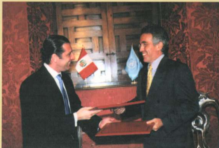
El Director General de la ONUDI, Lic. Carlos Alfredo Magariños, y el Ministro de Relaciones Exteriores, Dr. Diego García Sayán, en la firma del convenio.

En este sentido, a fin de brindar el apoyo técnico en el área de los proyectos del Plan Binacional de Desarrollo de la Región Fronteriza Perú-Ecuador; la ONUDI participará a través del Proyecto "Uso sostenible de la Biodiversidad", con un monto de US$ 150 mil, para lo cual desarrollará estudios sobre usos alternativos de la biodiversidad en la zona de Loreto y del noreste de la cuenca del Marañón con el propósito de identificar nuevas oportunidades para el desarrollo sostenible a favor de la población de dichas regiones, así como contribuir a la conservación de la flora y fauna del ecosistema que comparten el Perú y el Ecuador.