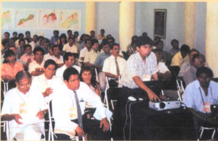
Grupo de participantes del Foro "Tumbes, debate y propuesta para el desarrollo".

La búsqueda de alternativas de progreso en los diferentes ámbitos de actuación del departamento de Tumbes fue uno de los objetivos centrales del Foro "Tumbes: Debate y Propuesta para el Desarrollo",