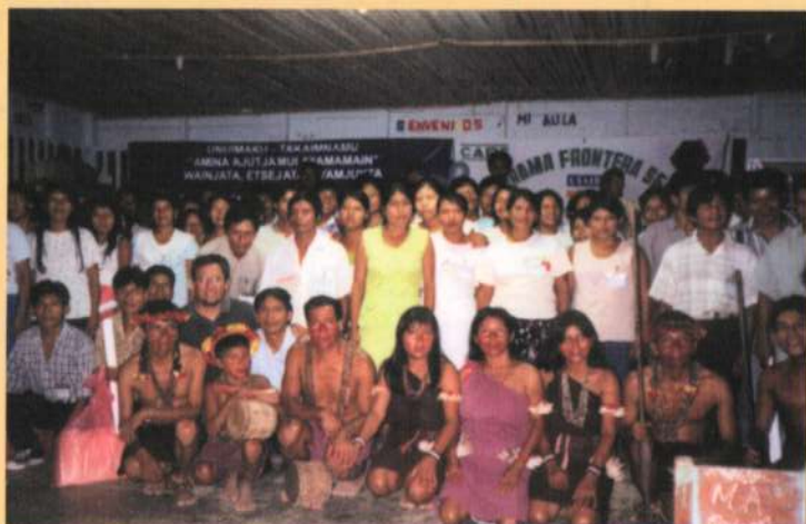
Líderes indígenas participantes de los talleres "Derechos Humanos y Ciudadanía".

La provincia de Condorcanqui, en el departamento de Amazonas, habitada desde tiempos ancestrales por el pueblo Aguaruna, ha sido el escenario de diversas actividades planificadas por el Programa Frontera Selva.