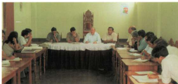
Miembros de la Comisión del viaje de reconocimiento de la cuenca del río Chinchipe con representantes de instituciones y organizaciones locales.

Por otro lado, el viaje hizo posible la evaluación de los avances en cuanto a la