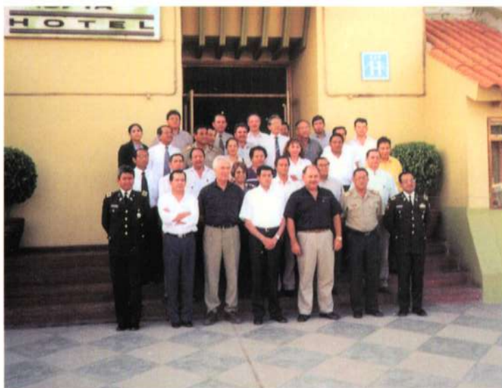
Participantes de la reunión del Grupo Binacional Peruano - Ecuatoriano para la implementación de los CEBAF.

El 14 y 15 de febrero en Tumbes se llevó a cabo la Reunión del Grupo Binacional Peruano Ecuatoriano para la implementación del CEBAF Huaquillas-Aguas Verdes y del CEBAF La Tina-Macarará, con el objeto de coordinar acciones para una pronta instalación de dichos centros binacionales.