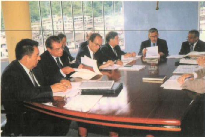
Representantes de los Directorios del Plan y el Fondo Binacional en la reunión en Zamora, Ecuador.

En la ciudad ecuatoriana de Zamora el pasado 29 y 30 de enero, tuvo lugar la IX Reunión del Directorio Ejecutivo Binacional del Plan Binacional Perú - Ecuador, la X Reunión de Directorio del Fondo Binacional para la Paz y el Desarrollo y la I Reunión del Grupo Binacional de Promoción de la Inversión Privada (GBPIP), en las cuales participaron sus respectivos miembros.