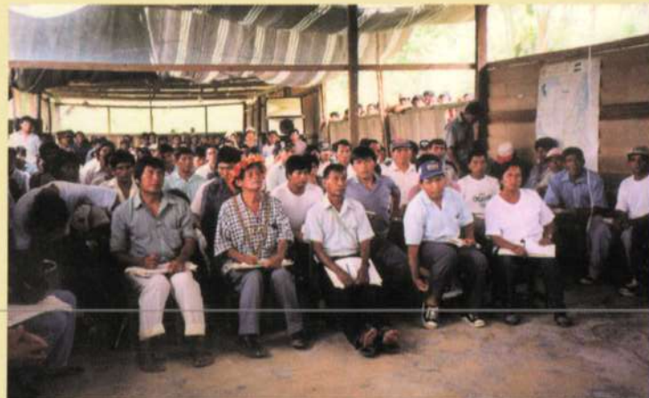
Pobladores de las comunidades nativas y de asentamientos de colonos de Tayunza, Provincia de Condorcanqui, que participaron en el taller.

Los objetivos del evento se centraron en la necesidad de que los participantes conozcan sobre las funciones que cumplen las diferentes entidades públicas, identifiquen a las instituciones